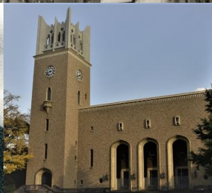
佐藤功一 早稲田大学 建築学教室 本庄アーカイブズ