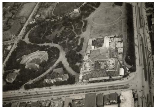
市政会館建設中の日比谷公園(1929年頃)

第1会場：市政会館 1階展示ギャラリー 第2会場：市政会館 地階063号室 開館時間：9:00～18:00 休館日：日曜・祝日(土曜は第1会場のみ) 入場無料