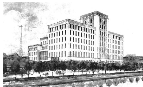
『東京市政調査会館競技設計図集』より 1等当選 工学博士佐藤功一氏案(背景図)

会場：市政会館1階 市政専門図書館内 開館時間：9:30～17:00 休館日：土日・祝日 入場無料